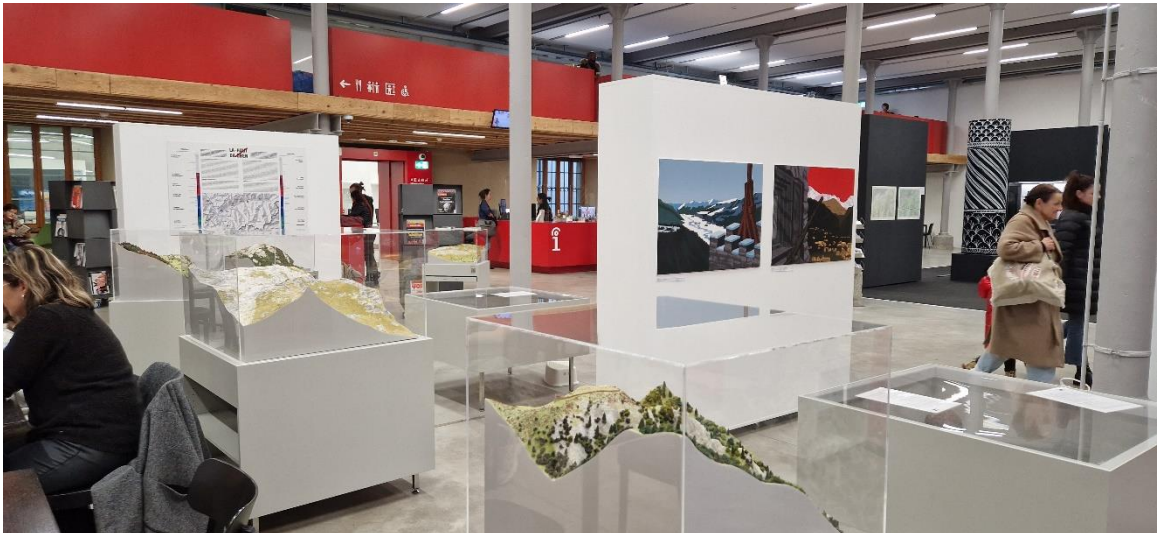
EXPOSITION SITES FORTIFIÉS, SION